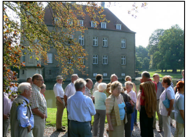
Exkursion zum Schloss Heeren

Ein gemeinsames Kaffeetrinken sorgte für einen gemütlichen Abschluss des rundum gelungenen Tages. Dr. Kracht teilte abschließend mit, dass der Heimatgebietstag „Hellweg“ im Jahr 2007 in Lünen stattfinden werde, wieder als Gemeinschaftsveranstaltung mit dem Heimatgebiet Münsterland.